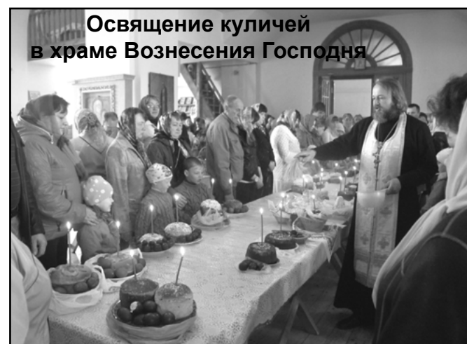
Освящение куличей в храме Вознесения Господня

нас. Для русского народа православная вера - это та основа, которая всегда помогала и помогает обществу жить и развиваться в русле многовековых христианских ценностей. Милосердие и терпение, сострадание и прощение, патриотизм и любовь к ближнему — вот чему учит нас Господь!