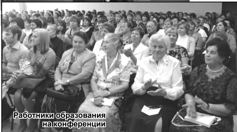
Работники образования на конференции

В Калязине прошла традиционная августовская конференция работников образования района.