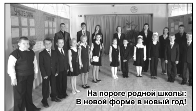
На пороге родной школы: В новой форме в новый год!