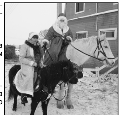
3 фото - Приезд Деда Мороза со Снегурочкой