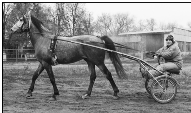
1 фото - Кудесница с сыном Кротким

Спасибо Вам всем за неравнодушную позицию!