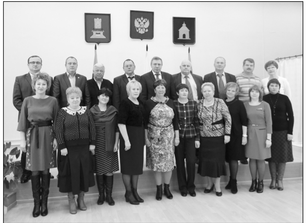
Председателя Собрания депутатов Калязинского

Также была утверждена форма удостоверения